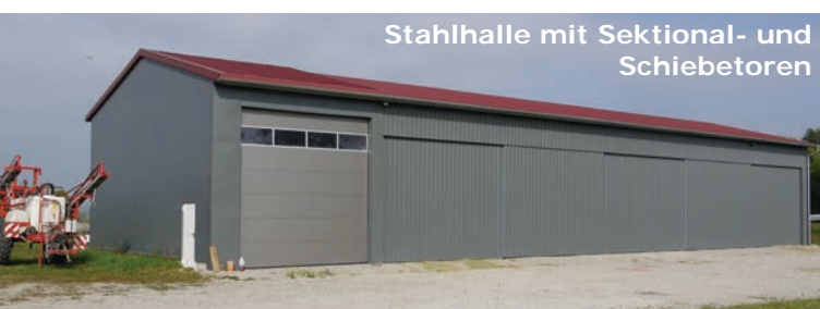
Stahlhalle mit Sektional- und Schiebetoren