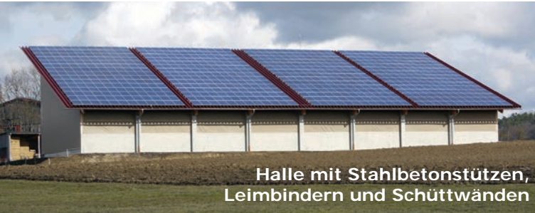
Halle mit Stahlbetonstützen, Leimbändern und Schüttwänden